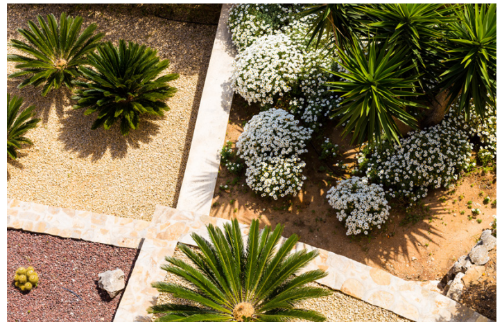
Un jardín resistente a las sequías.